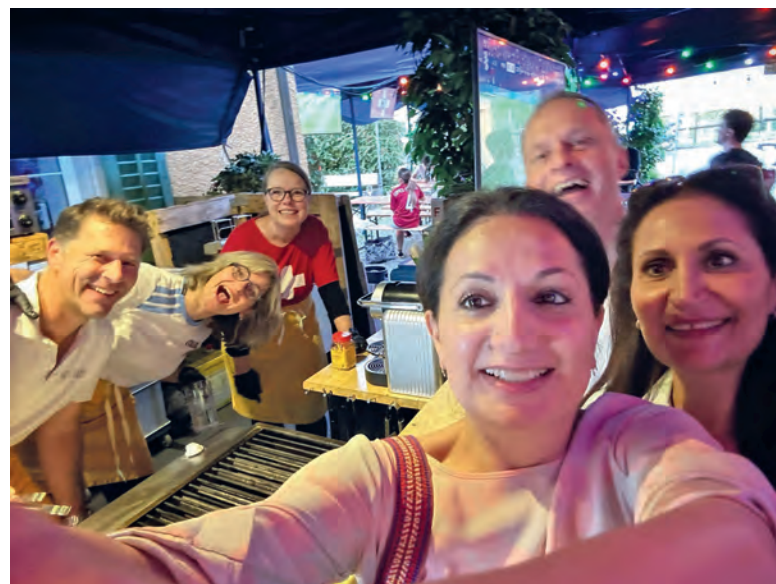
Die Fashionistas ALL SISTERS durften auch nicht fehlen.