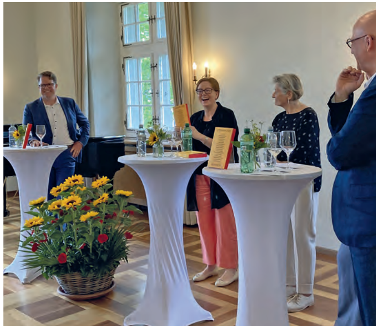
Die Gemeindeverwaltung freut's: Nach unzähligen Stunden Arbeit ist es vollbracht und das Buch gedruckt.