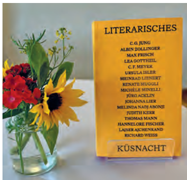
Ein Buch von und für Küssnachterinnen und Küssnachter.