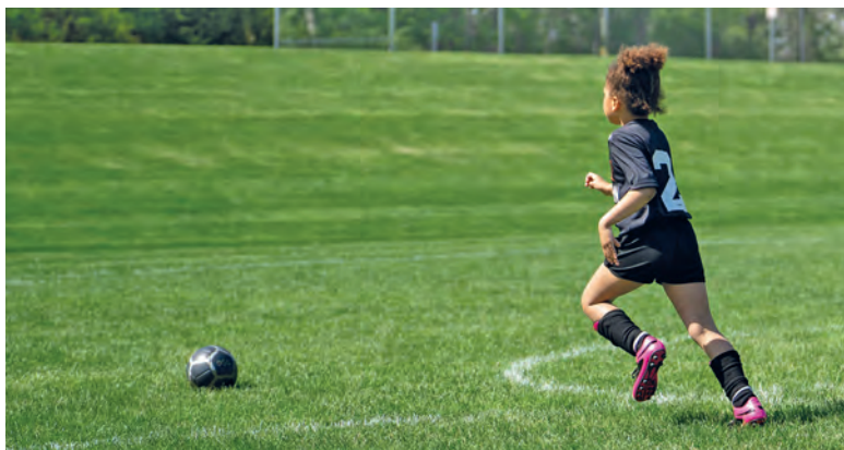
Ob der nächste Xhaka unter den Küssnächter Kids zu finden ist?

Weitere Infos und Spielzeiten: www.fck.ch