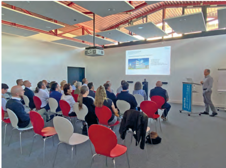
Präsentation vom Geschäftsführer der Werke am Zürichsee AG höchstpersönlich.

In der geselligen Runde wurde noch lange über die Faszination für die alltäglichen Dinge wie Strom, Heizung