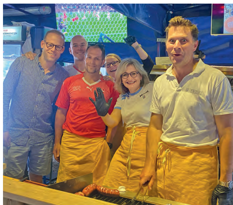
Der GVK-Vorstand am Grill.