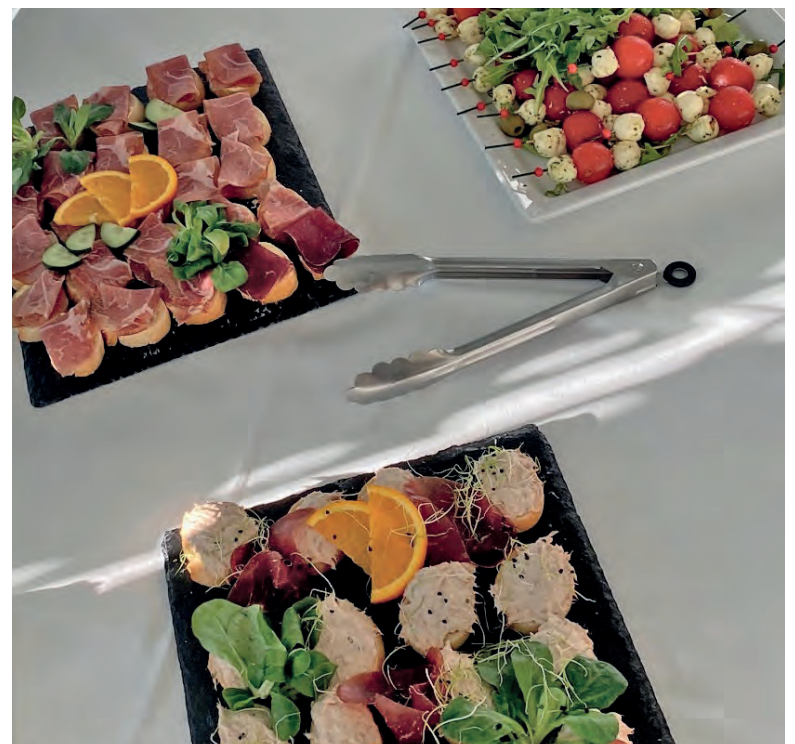
Nach dem Rundgang wurde für die hungrigen Gewerbler aufgetischt.