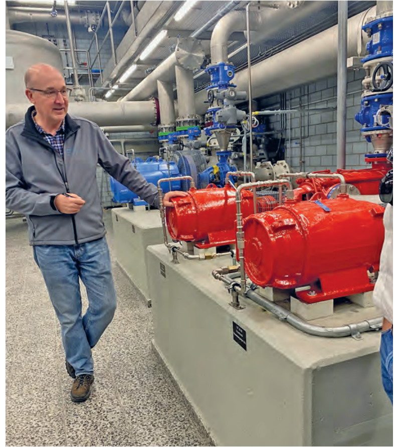
In der Werke am Zürichsee AG versteckt sich innovative Technologie.

und Trinkwasser geredet. Und alle waren sich einig: «Ab jetzt werden wir alle viel bewusster auf das Wasser un-