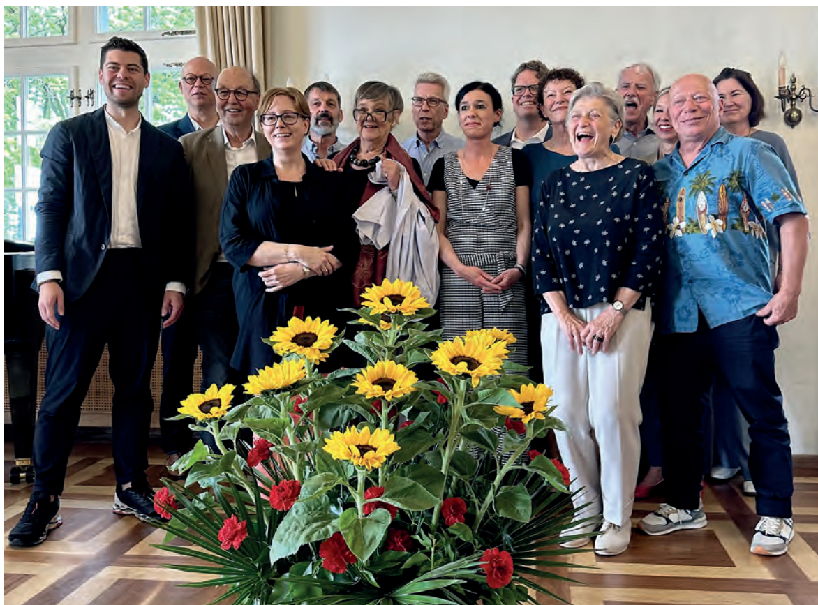
Die Mitwirkenden des Buchprojekts stellen sich zum Gruppenfoto auf.

Es ist im Buchhandel und im Gemeindehaus Küssnacht zum Preis von Fr. 35.– erhältlich.