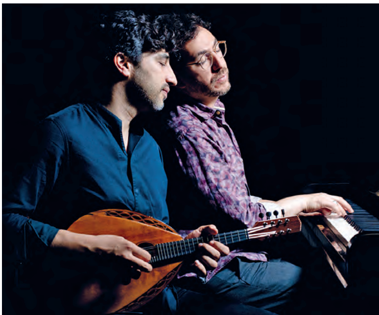
Classic meets Jazz: Avi Avital, Mandoline und Omer Klein, Piano.