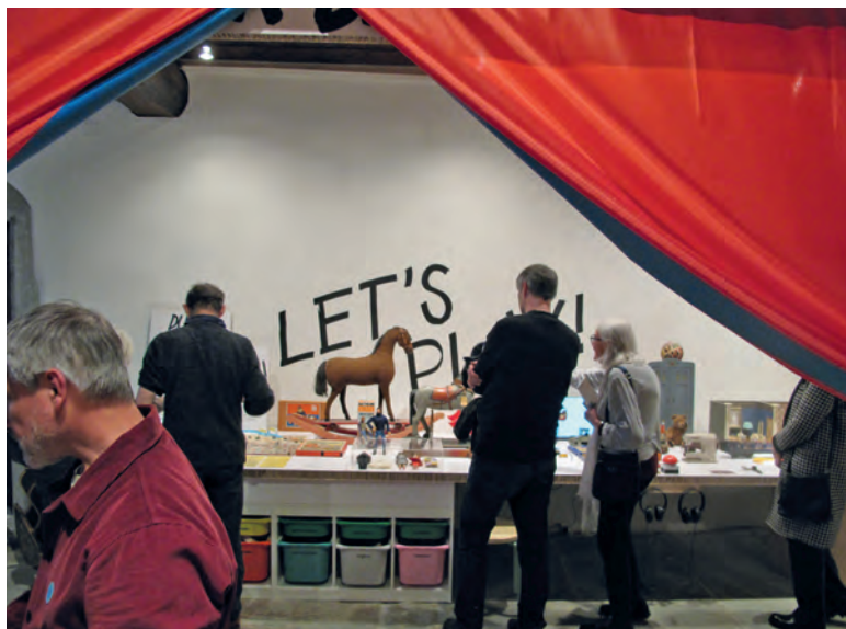
Der Eröffnungstag der Ausstellung war ein voller Erfolg.

gibt das Museum auch Einblick in seine Spielzeugsammlung. Unter den ausgestellten Spielsachen befinden sich zudem einige Leihgaben von acht verschiedenen Personen. Diese beschreiben, wie wertvoll und prägend diese Spielsachen in der eigenen Lebenswelt sind; Spielen ist Teil der eigenen Biografie und hinterlässt viele Spuren in den Erinnerungen. Die Besucherinnen und Besucher sind denn auch eingeladen, in der Ausstellung eigene Geschichten und Erinnerungen zu den ausgestellten Spielsachen zu notieren. Oder auch zu einem eigenen Spielzeug, zu dem auch ein Foto mitgebracht und in einen Ordner eingeklebt werden kann.