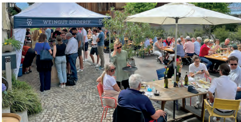
Volle «Ränge» auf dem Weingut Diederik.