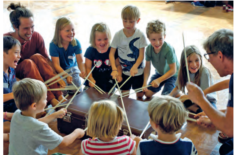
Letztes Mal stand die Musik im Fokus.

Künstlern wie Picasso, Calder oder Kandinsky vertraut machen können. Am Ende der KiKuWo 2024 wird es eine Ausstellung in der reformierten Kirche Küsnacht geben. Ausserdem können die Werke auf der digitalen Plattform kijumu-klick.ch bewundert werden.