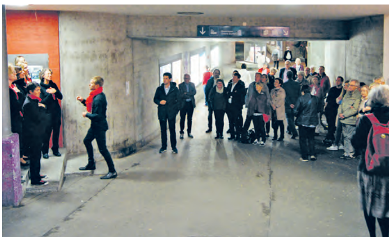
Die Unterführung als Resonanzkörper: Der b-livechor mit A-cappella-Musik sorgte mit kraftvollen Stimmen für viel Publikum.