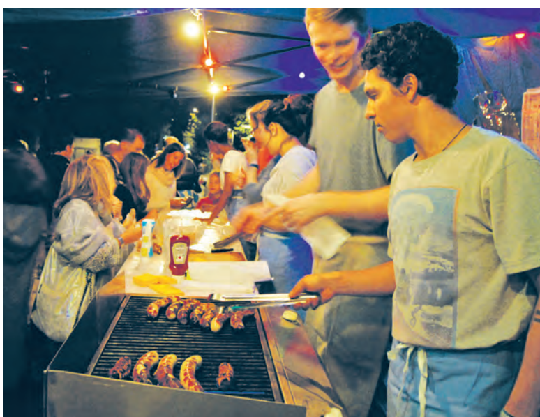
In der Sunnemetzg gab's Bratwurst und Bier von den Profis.