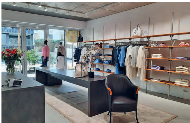
Viel Platz für sommerliche Fashion-Trends bei Ledergerber Mode.