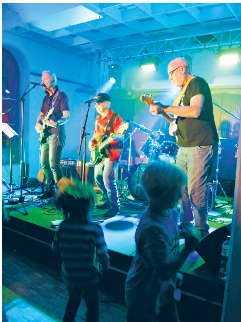
Im Inneren tanzte der Bär und die Kleinen mit den Bands um die Wette.