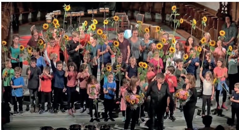
Abschlussaufführung in der Kirche 2022.

Gestalterische und auch tänzerische Aktivitäten wie zum Beispiel Ausdruckstanz mit Patricia Gonzenbach werden in diversen Ateliers angeboten, wo sich die Kinder unter anderem mit den Arbeiten von so namhaften