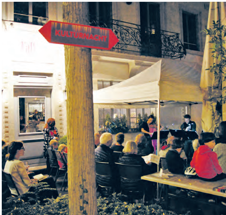
Vor dem Falken hörte man Volkstanz-Musik der besonderen Art von «Les esprits».

gungsangebots verantwortlich. Für die Kulturschaffenden bedeutet dies, dass sie ihre Darbietungen selber organisieren oder sich an einen Veranstaltungspartner wenden. So wird das Publikum in den Genuss einer kulturellen Vielfalt kommen, auf die Küssnacht stolz sein kann. Für die Teilnahme an der Informationsveranstaltung wird um Anmeldung bis bis Donnerstag 9. Mai an vorstand@kulturelle-vereinigung-kuesnacht.ch gebeten.