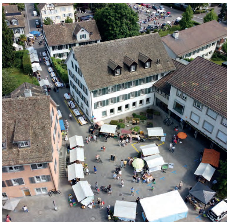
Wenn zwei Märkte zusammenspannen: Künsnacht am Markttag aus der Vogelperspektive.