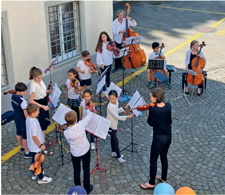
Musik in den Ohren und auf dem Tobelweg – die Musikschule und das Ortsmuseum spannen zusammen.

Am Samstag, 25. Mai 2024 findet in Küsnacht zwischen 10 und 14 Uhr der Musikschultag zusammen mit dem klingenden Museum statt. Dieses Jahr auch als Vorbote des musikalischen Junis in den Museen der Region Zürich des Netzwerkes muse-um-zürich. Es gilt: ausprobieren, mitsingen und spielen!