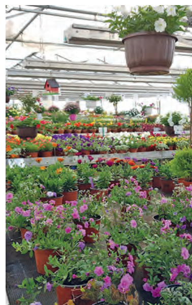
Das Angebot ist stetig gewachsen.

Tag der offenen Tür am Samstag, 11. Mai, von 8 bis 16 Uhr, Weinmangasse 65, 8700 Küssnacht