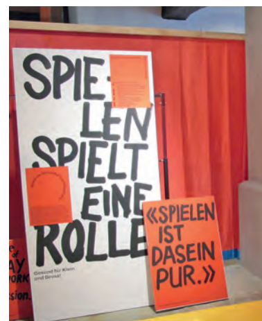
Spielen ist auch für Erwachsene gesund.

Im Begleitprogramm finden sich vom April 2024 bis März 2025 bewährte Künsnachter Angebote wie die gemeinsame Spielolympiade des Familienzentrums, der Ludothek sowie der Bibliothek Künsnacht sowie auch speziell für die Ausstellung erarbeitete Angebote wie ein Kreativ-Workshop für Erwachsene in der Freizeitanlage Heslibach oder ein Abend mit der Improvisationstheatergruppe