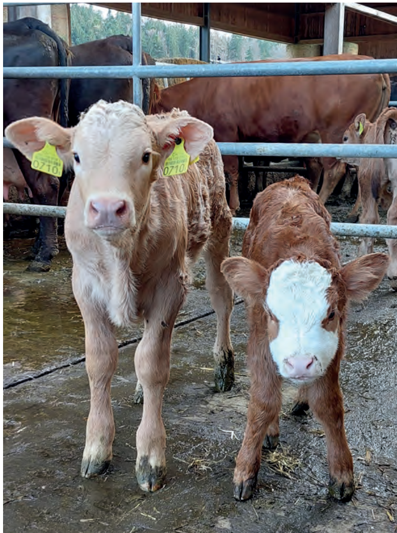
Das Kälbli rechts kam viel kleiner als «üblich» auf die Welt. Trotzdem ist es kerngesund und alles dran.