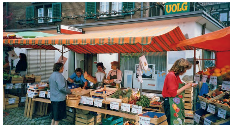
In den 80ern hatte die Gärtnerei einen Gemüseladen für den Direktverkauf.