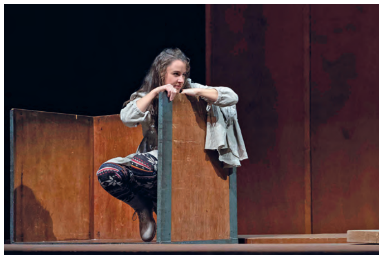
Julia aus Verona oder Vreni aus Seldwyla?