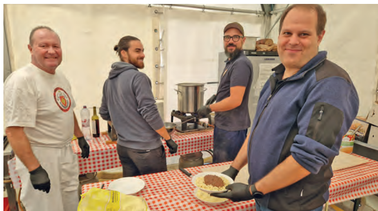
Das traditionelle Chackete mit Hörnli am Chilbi-Zmittag ist ein Highlight für die Gewerbler.