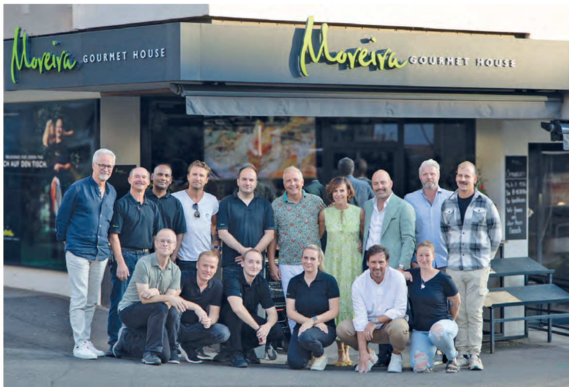
Bekannte und neue Gesichter beim Küsnachter Traditionsbetrieb.