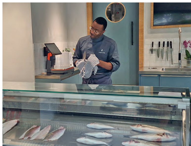
Clinton sorgt für glückliche Kunden und eine saubere Arbeitsfläche.