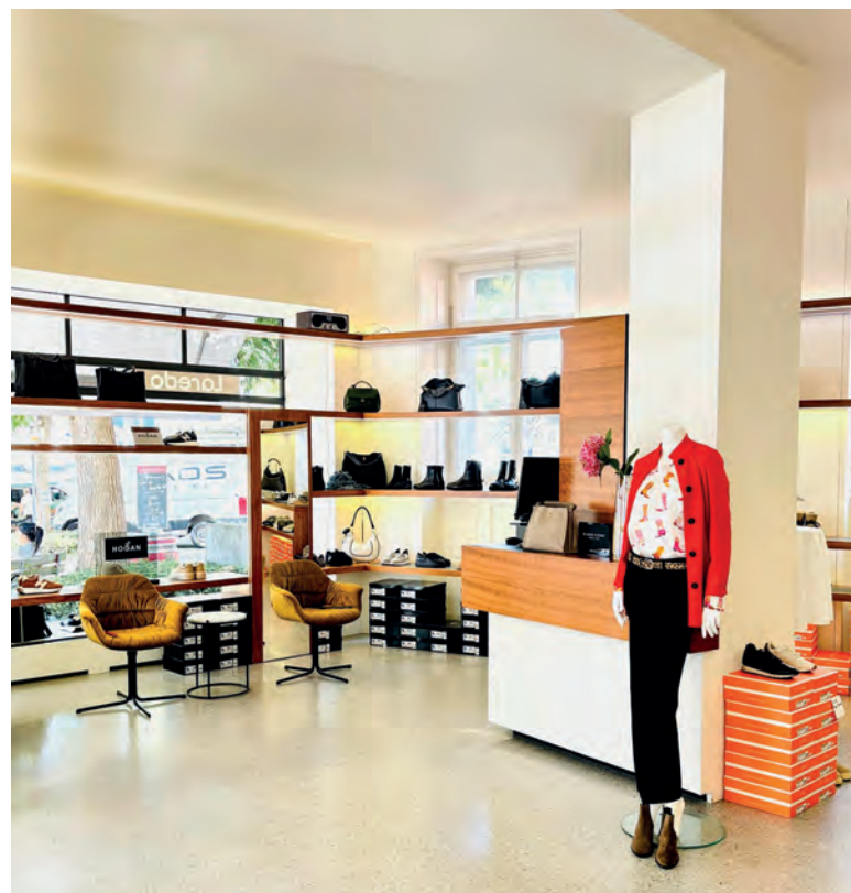
Einkaufserlebnis mitten im Dorf: Die neue Schuh-Boutique LAREDO.

LAREDO, Dorfstrasse 13, 8700 Küssnacht, 076 298 66 84. Montag bis Freitag: 9.30 bis 13 Uhr und 13.30 bis 18.30 Uhr, Samstag: 10 bis 17 Uhr.