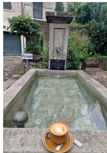
Kaffeegenuss auf dem Brunnen. Die Aussenplätze werden improvisiert und es fühlt sich ein wenig wie in den Ferien an: Monocle x OXEN.

Öffnungszeiten (noch bis Ende Sommer) sind Montag bis Freitag, 7.30 bis 16 Uhr, Samstag und Sonntag, 8.30 bis 17 Uhr. Ort: hinter Restaurant OXEN.