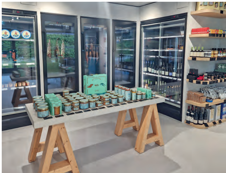
Mehr als Beilagen: Neben frischem Fisch bietet das Geschäft Weine, Pasta und Saucen, aber auch Fischkonserven an.