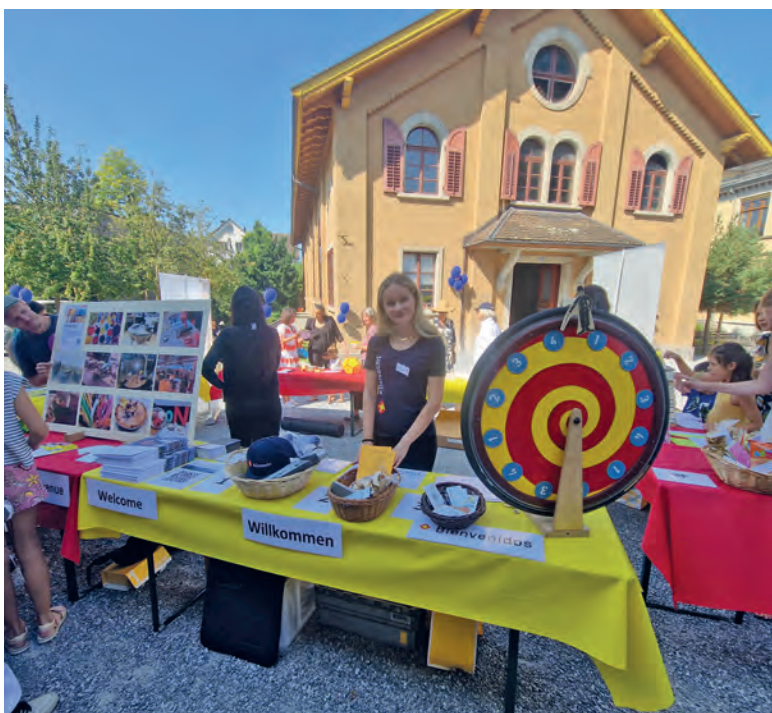
An verschiedenen Ständen lernten die Gäste das grosse Angebot von Küssnacht kennen.