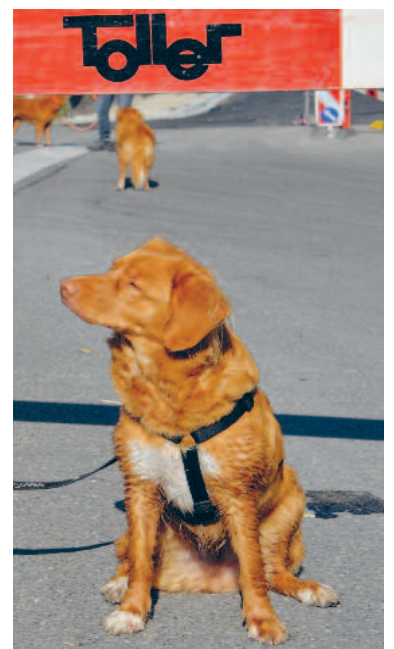
Strassenbaufirma Toller «meets» Toller-Hunde.