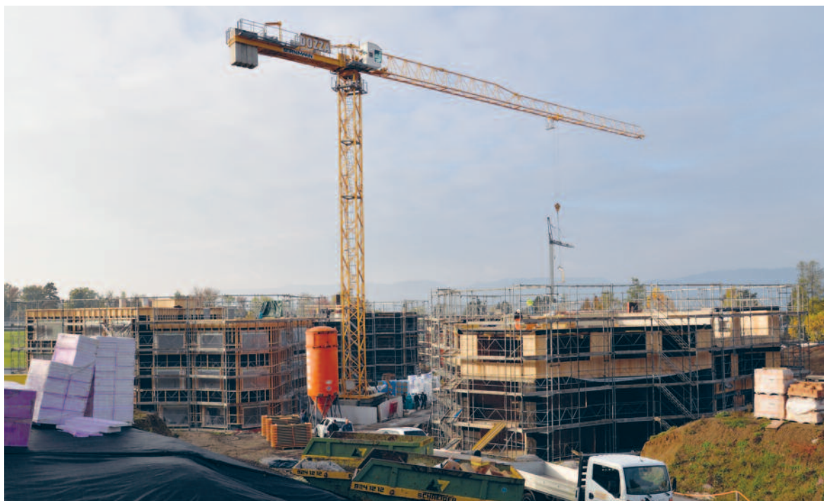
Blick auf die dreigeschossigen Gebäude der ersten Bauetappe im Hüttengraben.

Das Wohnangebot wird durch zumietbare Bastelräume, einen Gemeinschaftsraum, eine Kinderkrippe und einen Quartierspielplatz abgerundet. Als Beispiel sei die Miete für eine 4½ Zimmer-Wohnung genannt, welche netto Fr. 2'230 beträgt. Die Erstvermietung erfolgt ab Mai 2016. pd