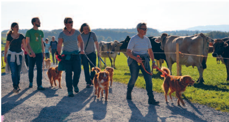
Wer hat vor wem mehr Respekt? Begegnungen beim Weiler Kaltenstein.

Am 10. Oktober fanden sich 13 Nova Scotia Duck-Tolling Retriever-Hunde (genannt Toller) in Begleitung ihrer Besitzer auf der Forch, Gemeindegebiet Küsnacht, ein.