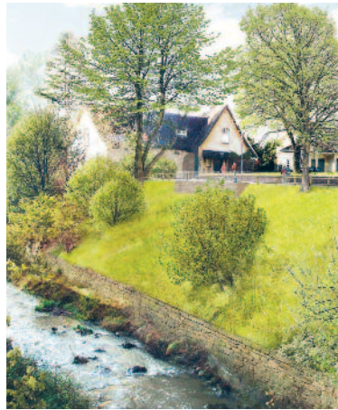
Das Gebäude integriert sich gut in die Landschaft.

Das Kleinwasserkraftwerk nutzt die Energie des Abwassers, das von Zumikon nach Küsnacht herunterfliesst. Das mit einem Feinrechen vorgereinigte Rohabwasser gelangt zuerst in ein Ausgleichsbecken. Von dort strömt es über eine Druckleitung ins Kraftwerk und treibt eine Turbine an. Bis zu 80 Liter Abwasser pro Sekunde verrichten diese Arbeit. So entstehen aus jährlich einer Million Kubikmeter Abwasser rund 370'000 kWh Strom. Das entspricht dem durchschnittlichen Verbrauch von etwa 90 Haushalten. Vom Kraftwerk aus fliesst das Rohabwasser in die ARA Küsnacht, wo es gereinigt wird.