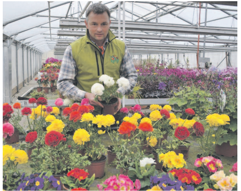
Blumenpracht, von Fredi Biedermann in der Gärtnerei Karrer gehegt und gepflegt.

Karrer Gärtnerei AG, Weinmannsgasse 65, 8700 Küsnacht, Telefon 044 910 07 65, www.karrer-gaertnerei.ch , info@karrer-gaertnerei.ch