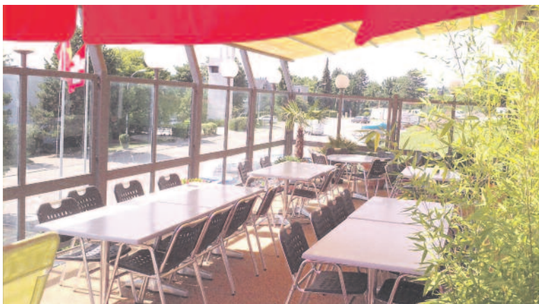
Sommerstimmung auf der Terrasse des Restaurants KEK ...