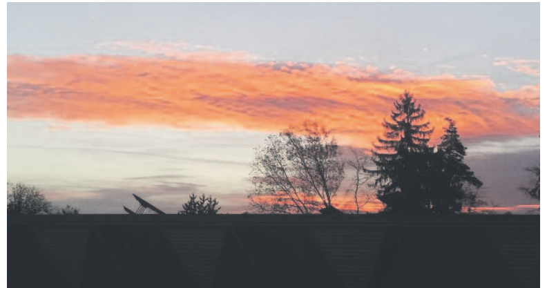
... mit Aussicht bis spät in die Nacht.

Täglich neu werden Menüs für die Gäste kreiert. Normalerweise ein gut-