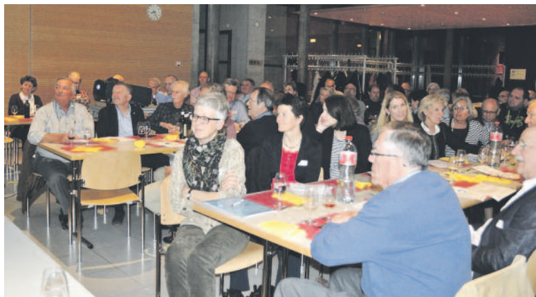
56 von insgesamt 64 Vereinen aus dem Vereinskartell waren an dessen GV vertreten.