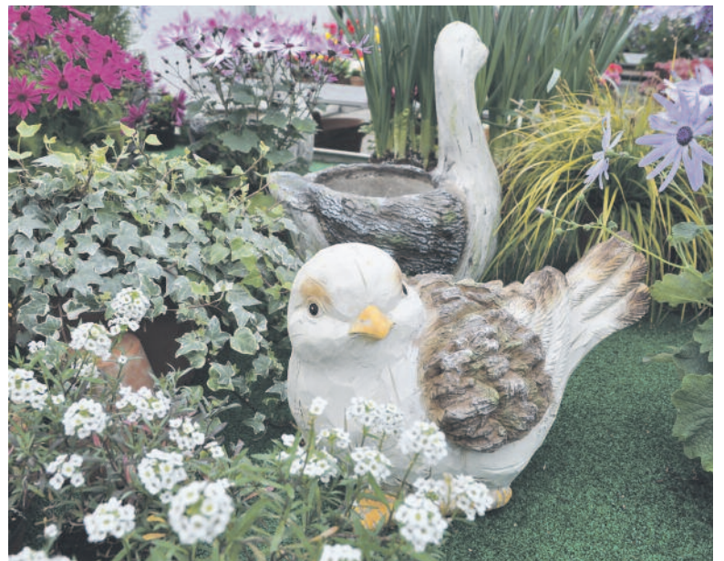
Die Auswahl an Blumen, Kräutern und selbst Tieren ist gross.