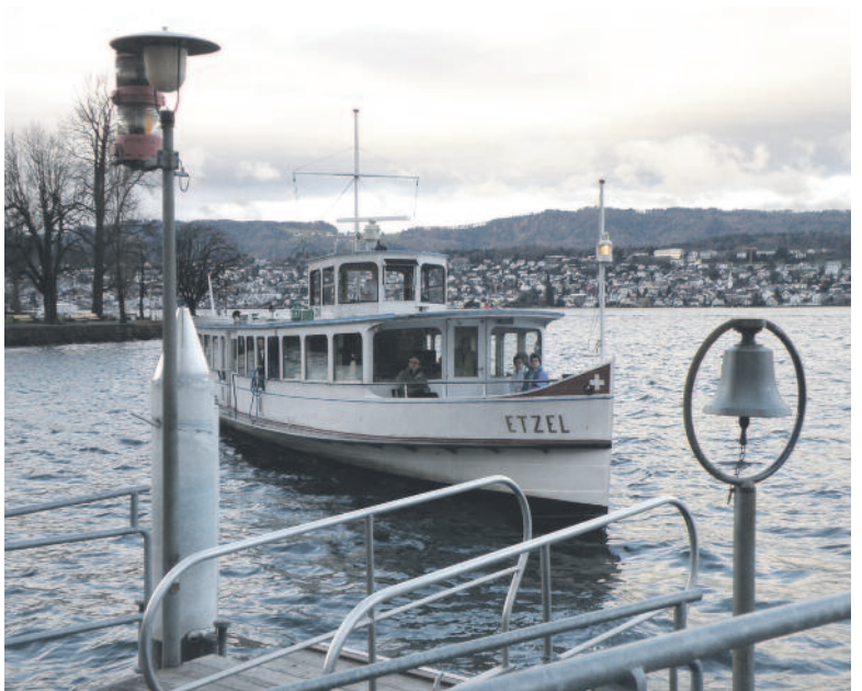
Jeweils am Dienstag oder Freitag bringt das Gipfelischiiff wieder Frühaufsteher nach Zürich. (zvg)

In der Saison 2014 nutzten durchschnittlich 82 Fahrgäste die Möglichkeit, auf dem Seeweg in die Stadt Zürich zu fahren. Es besteht also weiterhin ein hohes Interesse an diesem Kurs. Auch die erneute Bedienung der Haltestelle