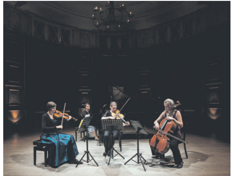
Musik aus drei Jahrhunderten mit dem Mondrian Ensemble im Seehof. (zvg)

Franz Liszts musikalische Materialien waren zeitlebens in Bewegung und wurden von ihm immer wieder bearbeitet. Dies lässt sich am Beispiel der verschiedenen Versionen der «Wiege», oder am Auftauchen von Fragmenten aus einer älteren Komposition in der «Romance oubliée» sehr schön nachver-