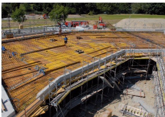
Das letzte Deckenelement über dem Eingangsbereich wird für das Betonieren vorbereitet. Im Vordergrund die Konturen des Innenhofs.