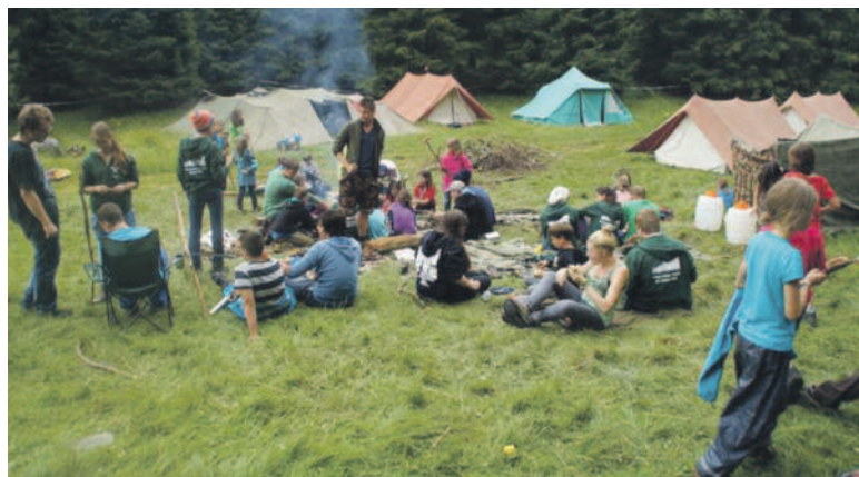
Ritterromantik in Sedrun.