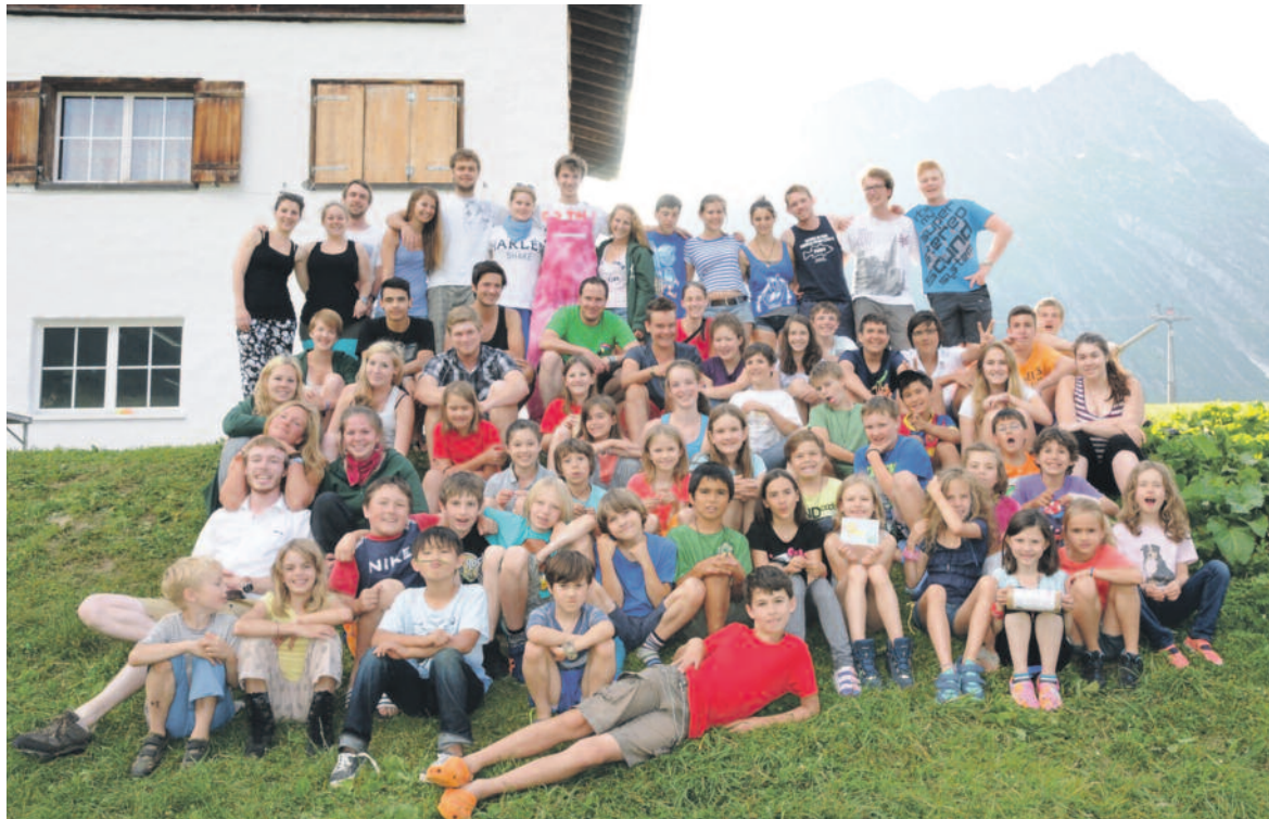
73 Kinder und Jugendliche haben ein spannendes Pfarreilager erlebt.

Durch das ganze Lagerprogramm zog sich die Geschichte des bösen Drachen «Sigi» und des Ritters «Fredi», der den Kampf mit ihm aufnahm. Höhepunkt des Lagerlebens war ein vierundzwanzigstündiger Wettkampf. Dabei ging es um die Eroberung von fiktiven Dörfern, um das Sammeln von Rohstoffen und das Ergattern von Hinweisen, wo das goldene Ei zu finden sei. Die Kinder erlebten ein spannendes Spiel, in welchem Strategie, Köpfchen und Ausdauer gefragt waren. Durch den grossen