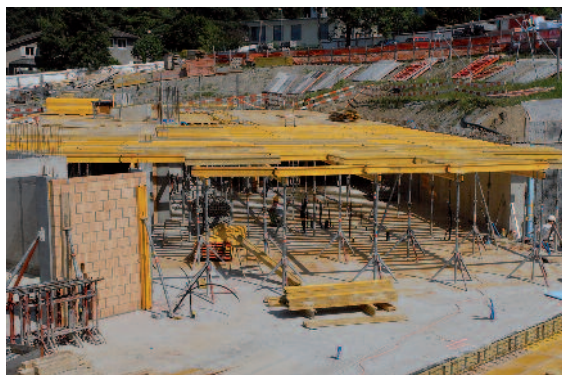
Die Schalung für die Decke des ersten Obergeschosses, Teil Mitte, wird vorbereitet.

Bereitstellungsanlage, welche in bester Betonqualität ausgeführt worden war. Zusätzlich wurde mehr schadstoffhaltiges Material festgestellt. Aus diesen Gründen haben die Rückbauarbeiten länger gedauert und haben Mehrkosten verursacht. Vor Weihnachten 2012 konnte die Grundsteinlegung stattfinden und die Tiefbauarbeiten wurden aufgenommen. Da uns wieder einmal ein strenger Winter beschert war, litten diese Arbeiten erheblich unter der Witterung und verzögerten sich entsprechend. Zudem zeigte sich, dass die Ausführung der Hangsicherung (Nagelwände) komplex und aufwändig war.