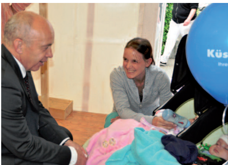
Ein Wort des Bundespräsidenten Ueli Maurer an die kleinsten Ausstellungsbesucher.