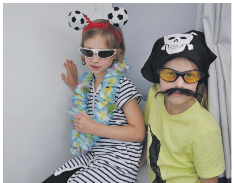
Zwischendurch eine lustige Fotosession beim Automaten am UBS-Stand.