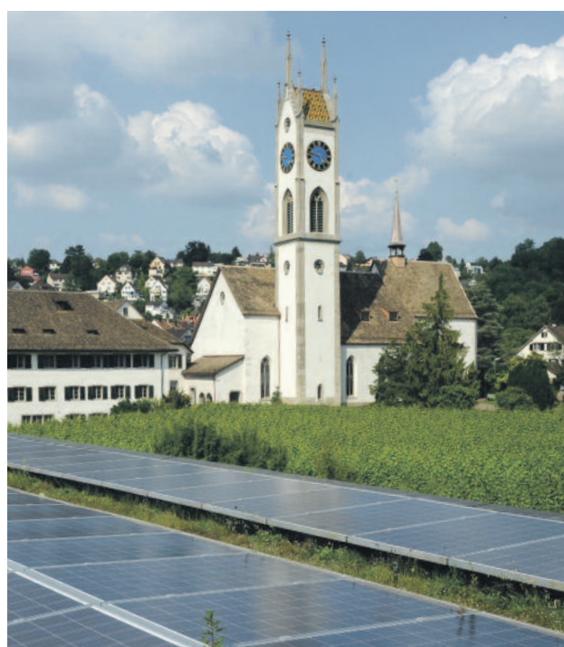
Die Kantonsschule Küsnacht bezieht die Hälfte ihres Stromverbrauchs aus ihren Solarpanels auf dem Schulhausdach. (Katia Weber)