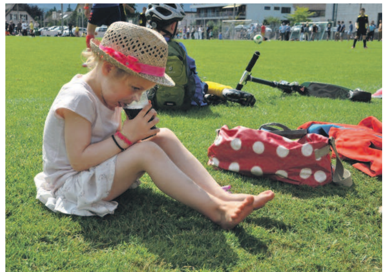
Selbst das Zuschauen gab Durst.