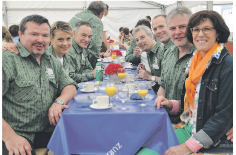
Vertreterinnen und Vertreter von der Gastgemeinde Saas-Balen haben die Bekanntschaft mit den Küsnachterinnen und Küsnachter ausgiebig genossen und nach ihren Jodel-Einlagen «kurz aber intensiv» in der Truppenunterkunft der HesliHalle geschlafen und machten sich am Sonntag auf zum Kantonalen Jodlerfest in Raron.