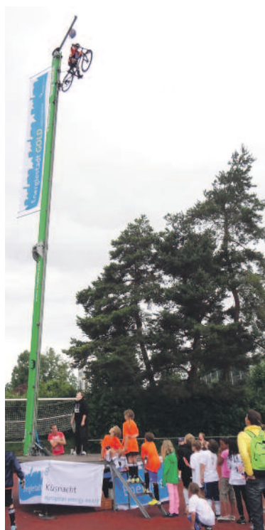
Mit eigener Muskelkraft 14 Meter senkrecht in die Höhe gingen Kinder mit der Energiestadt Küsnacht.