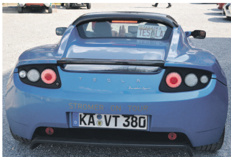
Vom Trabi bis zum schnittigen Schlitten: den innovativen Bastlern sind keine Grenzen gesetzt. (Ruth Weber)