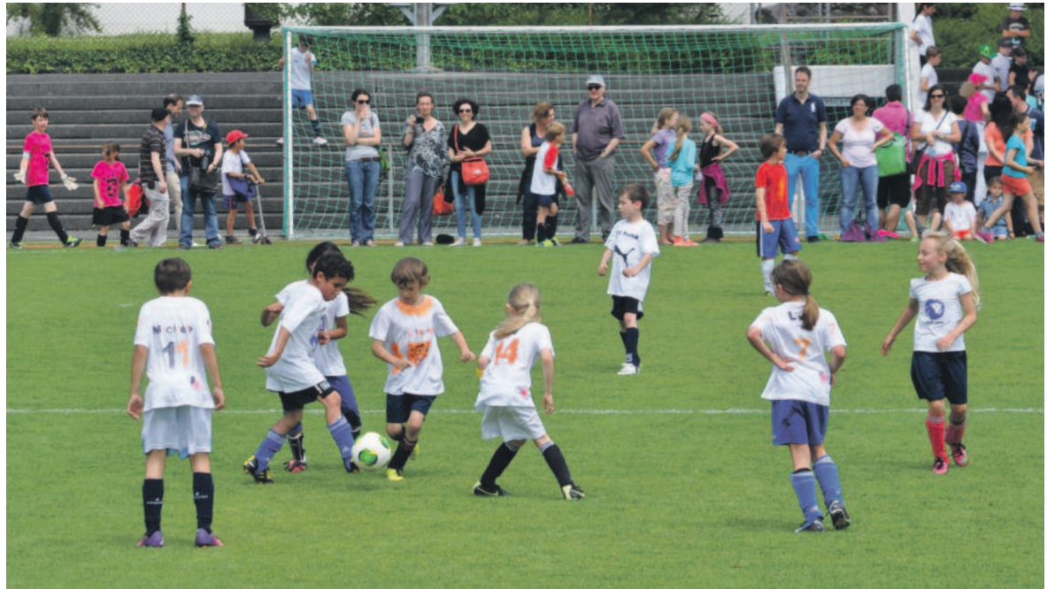
Rund 1000 sportliche Knaben und Mädchen beteiligten sich am Schüeli.