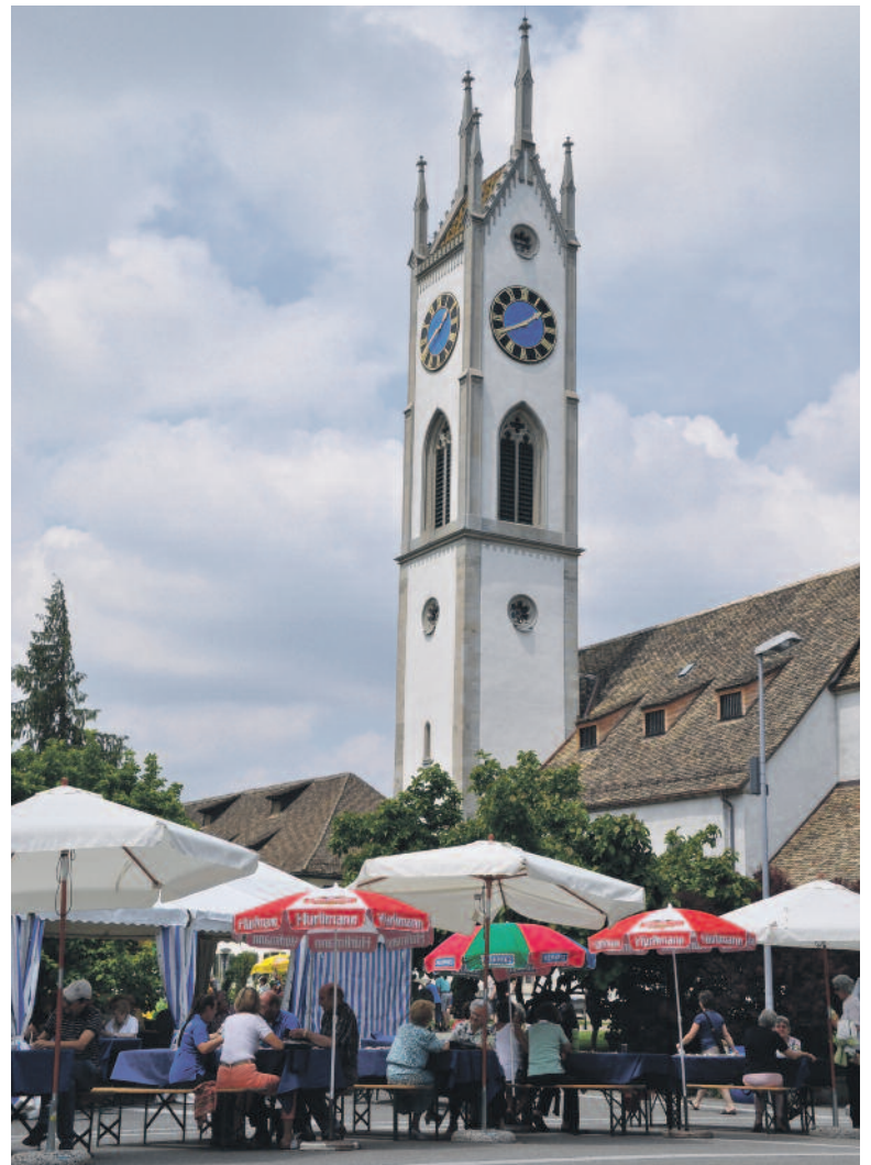
Genügend Wasser bot sich allen Besuchern an dem von der reformierten Kirchengemeinde Künsnacht organisierten Sommerfest.

www.helvetas.ch , Spendenkonto: PC: 80-3130-4, IBAN CH76 0900 0000 8000 3130 4, BIC:POFICHBEXXX