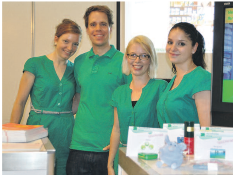
Die Mitarbeitenden der Apotheke Hotz waren begeistert von der «Superstimmung auch unter den Anbietenden» und wünschen sich «eine Wiederholung, die nicht erst nach weiteren 17 Jahren stattfindet».