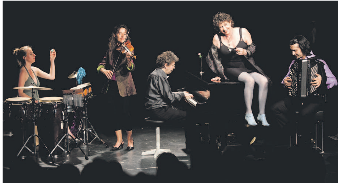
Rasant, innig, aufbrausend oder zuckersüss: das Kabarett Birkenmeier im Quintett.

Was ist weltformat? weltformat heisst: Immer gut abschneiden. Von Kind an solange so gut abschneiden, bis deine Welt so klein geworden ist, dass sie in dieses Format reinpasst. weltformat, ein Abend mit Chansons, Songs, und Geschichten, Einbrüche und Ausbrüche aus einer formatierten Welt,