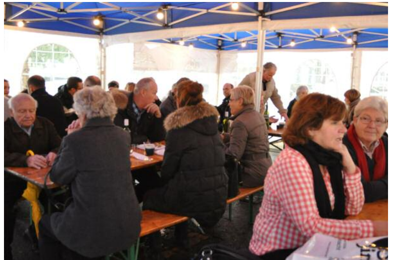
Auch das Raclette-Zelt des Gewerbevereins war voll besetzt.