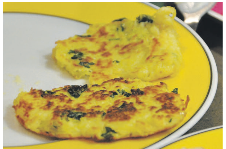
Luftig und bekömmlich waren ebenfalls die Härdöpfelchüechli.