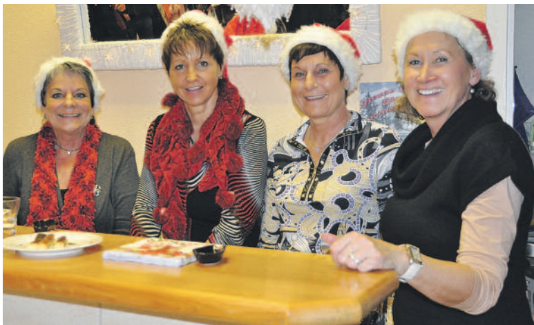
Vorweihnachtsstimmung an der Bar bei Birrer Sportartikel und Mode.