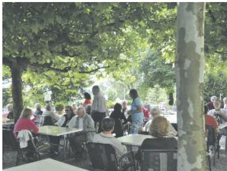
Begeistert und dankbar diskutierten die Ausflügler im Garten des alten Gasthofs Krone auf der Forch.