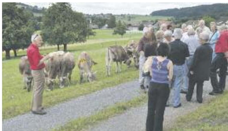
Reizvolle Landschaften und neugierige Rinder auf dem Küsnachter Berg.