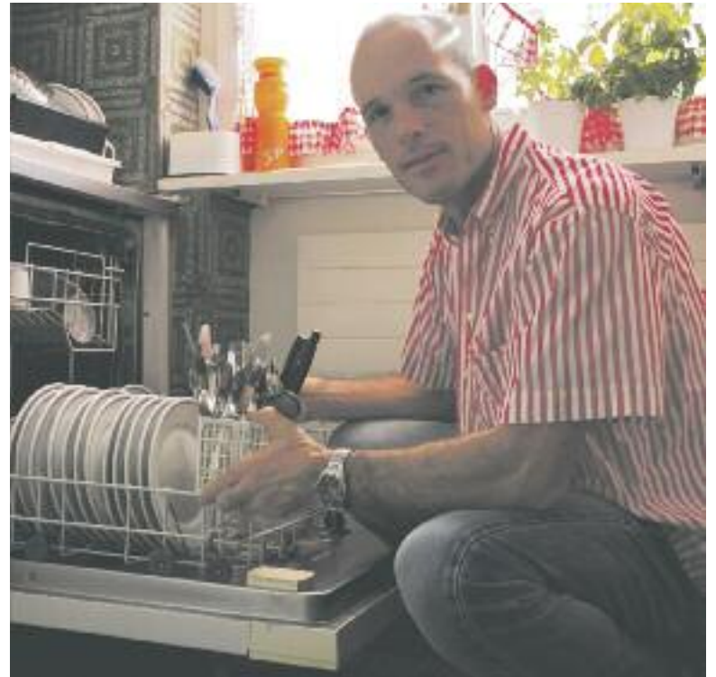
Bei normal verschmutztem Geschirr genügt beim Geschirrspüler das Sparprogramm. (Energistadt Küsnacht)

Achten Sie beim Kauf einer neuen Maschine zudem auf die richtige Grösse: Für einen Kleinhäusalt genügt ein Volumen von 9 Massgedecken, für eine grössere Familie wie die Schmidts müssen es mindesten 13 sein. Schliessen