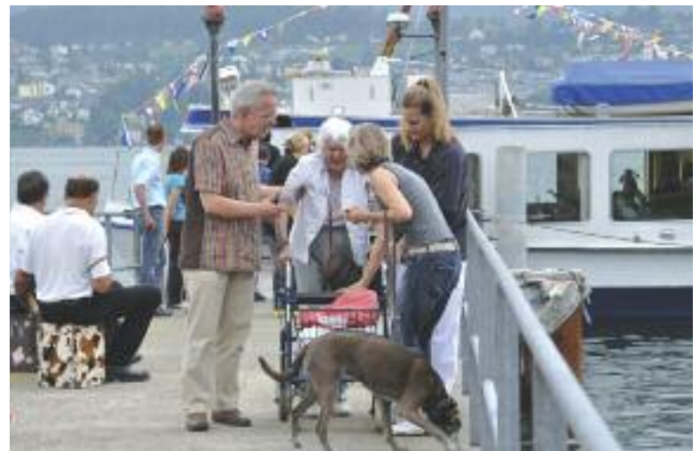
Mit herzlichem Empfang und guter Betreuung wurde der Umzug begleitet.