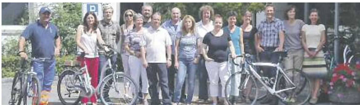
Haben zusammen fast 4000 Kilometer zurückgelegt: Die Teilnehmer von «bike to work» der Gemeindeverwaltung Küssnacht. (esk)

«bike to work» ist eine schweizweite Mitmachaktion zur Förderung des Velofahrens auf dem Arbeitsweg. Seit 2005 radeln im Juni motivierte Mitarbeiterinnen und Mitarbeiter um Ruhm und Ehre. In Viererteams eingeteilt versuchen sie, möglichst viele Kilometer zu sammeln. Für die fleissigsten Radlerinnen und Radler winken tolle Preise. Im Zentrum stehen aber das gemeinsame Spasshaben und der körperliche Ausgleich zum Büroalltag.