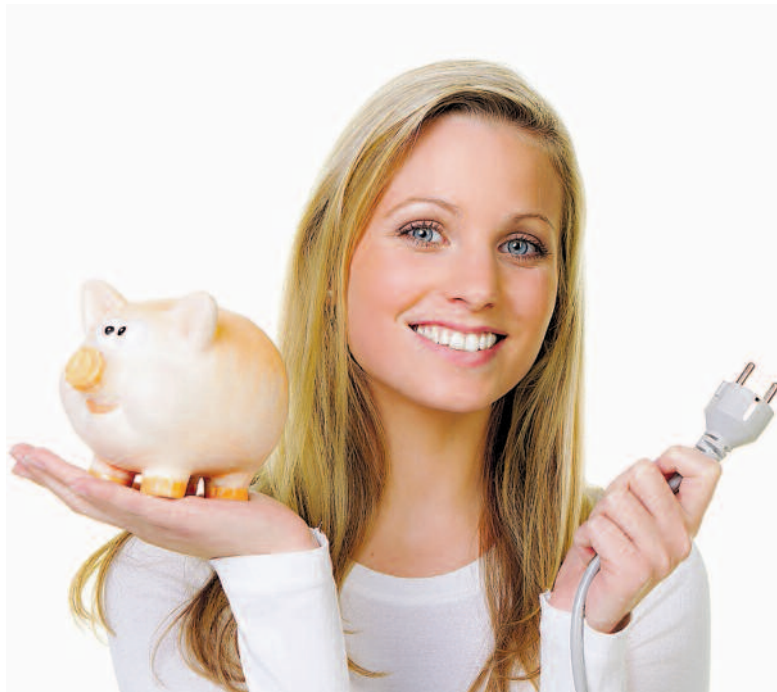
Wer im neuen Jahr weniger Strom braucht als im 2011, wird belohnt.

Mit dieser Aktion will die Energiestadt Küsnacht das Engagement ihrer Bevölkerung für den nachhaltigen Umgang mit Energie unterstützen. Die Gemeinde Küsnacht und die Werke am Zürichsee werden Mitte Januar mit der Stromrechnung detailliert über die Aktion informieren. esk