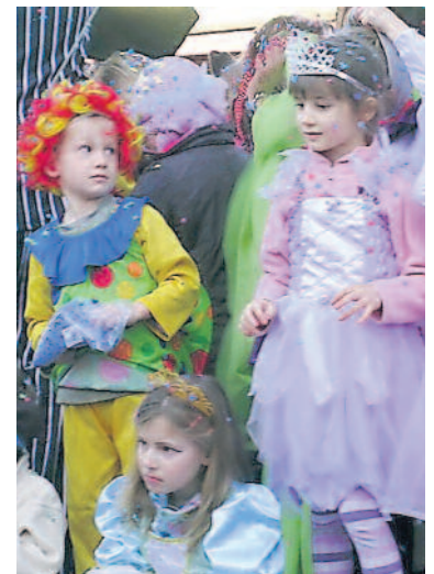
Prinzessinnen und Clowns am letztjährigen Umzug. (Ruth Weber)

Nach dem Umzug findet im katholischen Pfarreizentrum St. Georg eine vom Familienclub organisierte Konfetti-Party mit einem Maskenball statt. Auch für die erwachsenen Besucherinnen und Besucher bietet sich ein fröhliches Zusammensein. rw