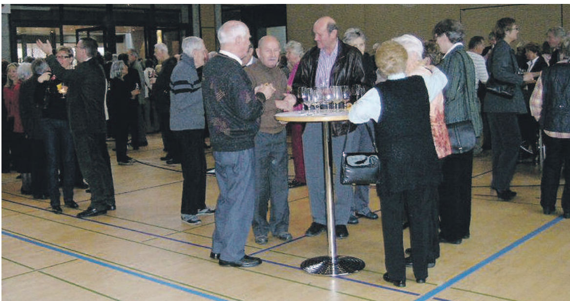
Ein zahlreiches Publikum nahm an dem von der Gemeinde offerierten Apéro teil.