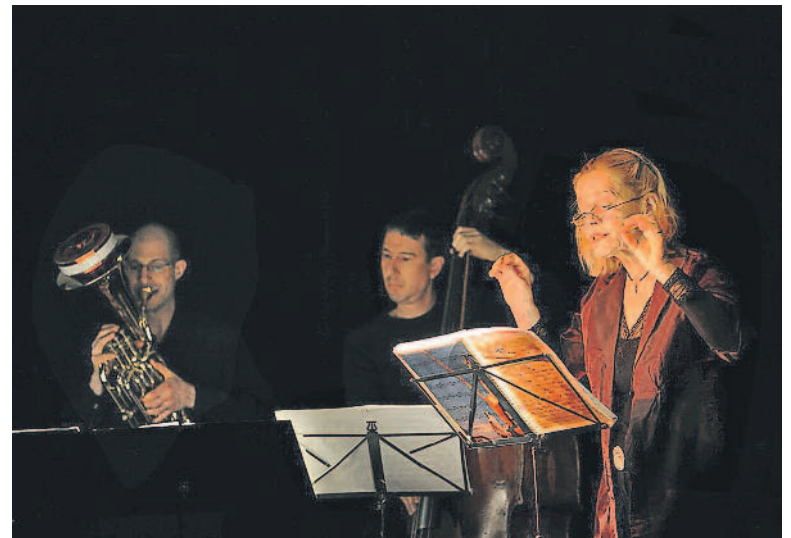
Intonation von den aus der Commedia ausgewählten Elementen.

Sonntag, 15. Januar, 17 Uhr, im Festsaal des Seehtofs, Hornweg 28, in Küssnacht, auf Einladung der Kulturkommission der Gemeinde Küssnacht. Eintritt frei, Kollekte.