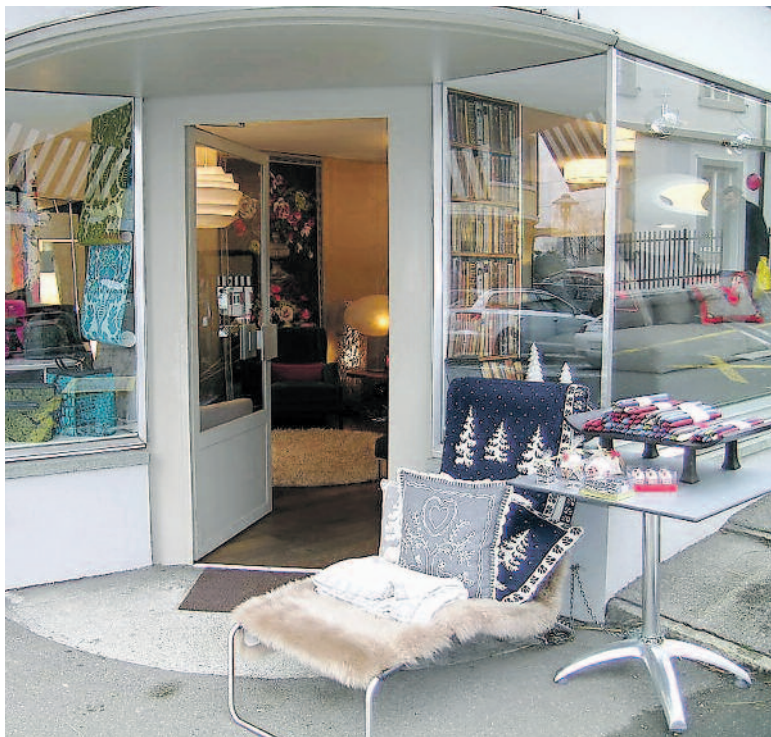
Offene Türen am Sonntagsverkauf auch bei Wohn-In. (Ruth Weber)