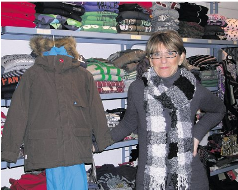
Warme Bekleidung zum Beispiel in der Kinderboutique Popcorn.