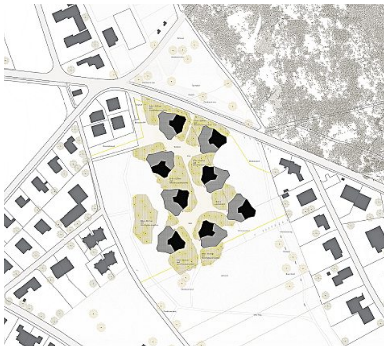
Situation im Gebiet Hüttengraben mit dem siegreichen, gut realisierbaren Projekt «Tortuga» mit acht Gebäuden von unverwechselbarer Architektur mit mehrheitlich Viereinhalb-Zimmer-Wohnungen und rund 70 Wohneinheiten.

Das Preisgericht würdigt die Projektidee «Tortuga» unter anderem wie folgt: Das Projekt konzentriert sich mit acht lose verteilten, mehrfach geknickten Baukörpern in der Mitte des Areals, lässt grosse Teile der Ebene und des Hanges frei und trägt damit dem fließenden Landschaftsraum am Siedlungsrand hervorragend Rechnung. Ein