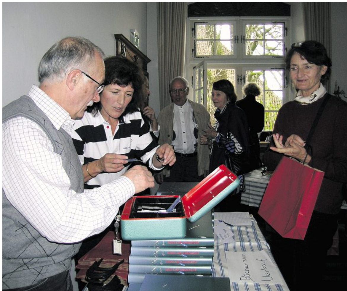
Druckfrisch gingen die ersten Exemplare «75 Jahre Seeclub Küssnacht» im Seehof über den Verkaufstisch. (Ruth Weber)

Buchbestellung unter www.seeclubkuesnacht.ch