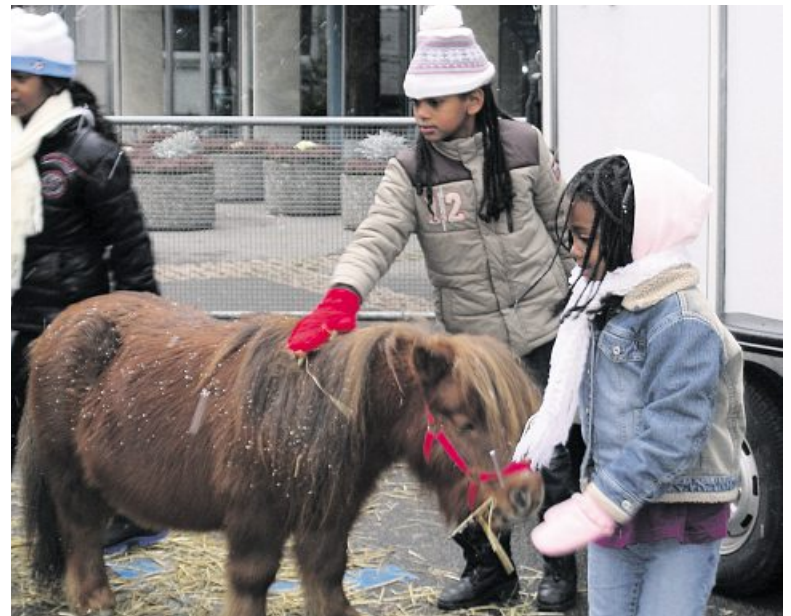
Kinder lieben den nahen Kontakt zu Tieren.