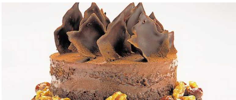
Der diesjährige «Prominententisch» wartet mit «Gluschtigem» auf.

Am «Prominententisch» in der Chrotteggrotte Küsnacht stellen sich am 17. Januar zwei Persönlichkeiten aus dem Umfeld der Gastronomie den Fragen von Rolf Guggenbühl.