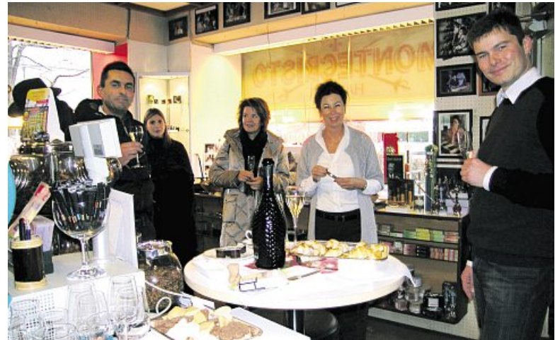
Herzliches Ambiente in der Tabatière.

einem breiten Sortiment ist.» Ein Sonntag bietet sich für diese Werbung als ideal an, weil so die ganze Familie hingehen und sich ohne Hektik über das Angebot informieren kann. Manche Besucherinnen und Besucher kommen jeweils zielgerichtet zum Einkaufen, stellen weitere Gewerbevereinsmitglieder fest, während der vorweihnachtliche Bummel durch die Ladengeschäfte auch dieses Jahr wieder ein beliebter Treffpunkt war. «Wir möchten stets auch mit Geselligkeit zu einem lebendigen Dorfleben beitragen», sagten die GVK-Vorstandsmitglieder hinter dem Raclettestand im geheizten Zelt. rw